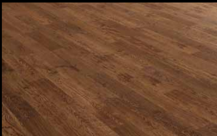
Golden Saddle Oak - 10GSH3 (Aussi offert en 10GSH5)