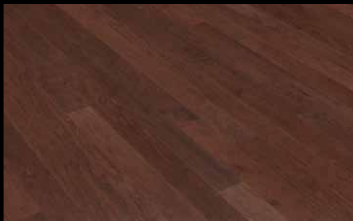
Dark Gunstock Oak - 10DGH3 (Aussi offert en 10DGH5)